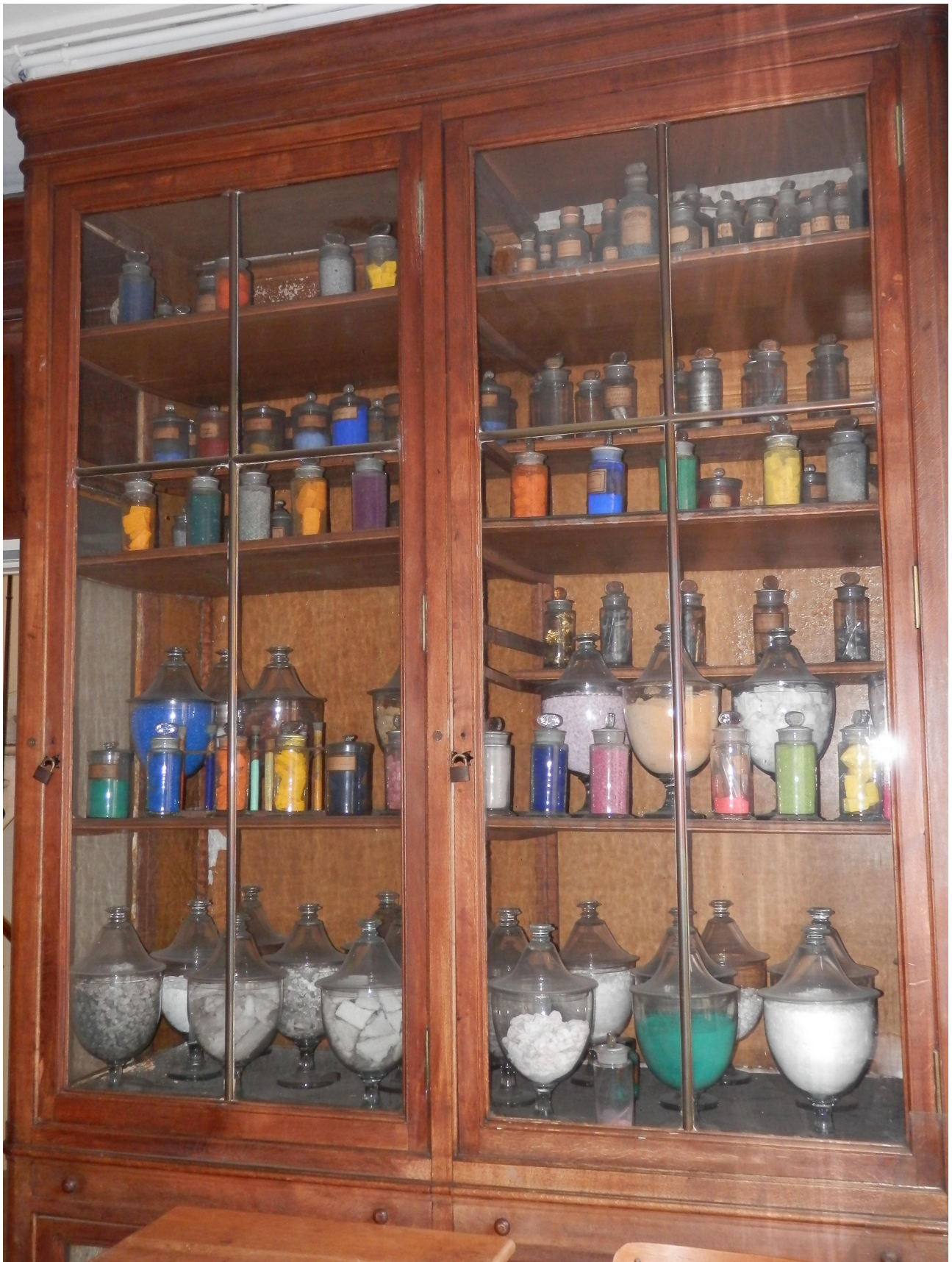
Quelques flacons dans une vitrine du bureau de Michel-Eugène Chevreul au Muséum national d'Histoire naturelle

Retransmission en direct (envoi du lien aux inscrit.e.s quelques jours auparavant)